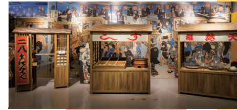
江戸時代の屋台の再現 (東京会場での展示)