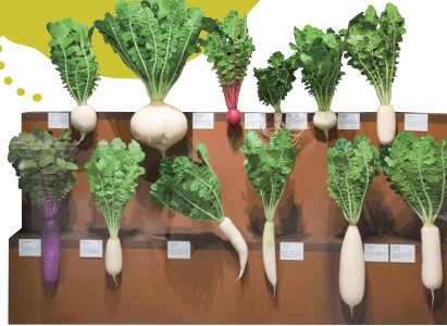
多彩な地ダイコンレプリカ 国立科学博物館 (東京会場での展示)