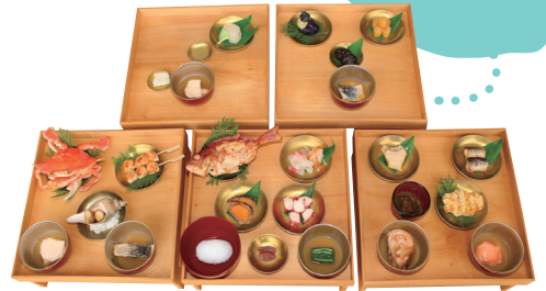
織田信長が徳川家康をもてなした本膳料理の再現模型 奥村彪生監修 御食国若狭おばま食文化館展