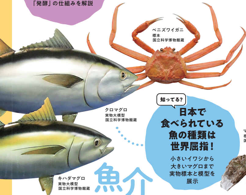
キハダマグロ 実物大模型 国立科学博物館