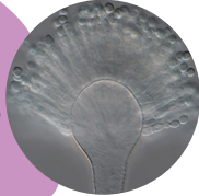
コウジカビ 顕微鏡拡大写真